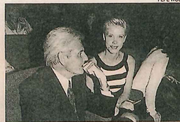
Acordes con el evento, Sergio Denis y su esposa asistieron a la presentación del Primer Congreso de Moda, Peinado y Belleza. Se sabe que el cabello del cantante -con canas como "reflejos"- siempre marcó su look.