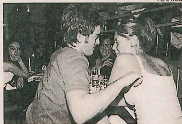
Desde que Pablo Rago y María Carámbula blanquearon su romance, el galancito no pierde el tiempo y ha dejado de preocuparse por la presencia de fotógrafos y miradas indiscretas a la hora de demostrar su cariño. Ahora, los tortolitos no dejan pasar ni un minuto sin caricias y besos.