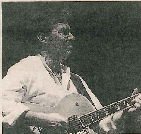
El guitarrista dio una sola función ayer y no alcanzó a llenar el Opera.